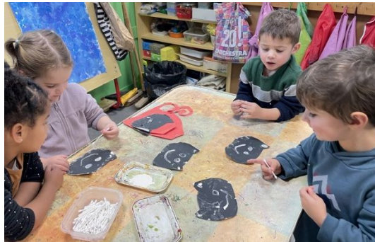
Peindre les différentes du corps Déchirer du papier en bandes Réaliser un cadre