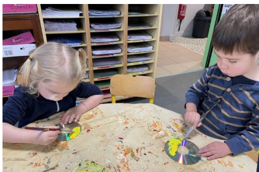
Création d'un tableau pour un poisson marin...