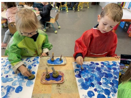
Réalisation d'un fond marin pour le poisson...