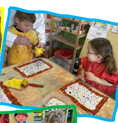
Le tableau de PÂQUES se finalise...