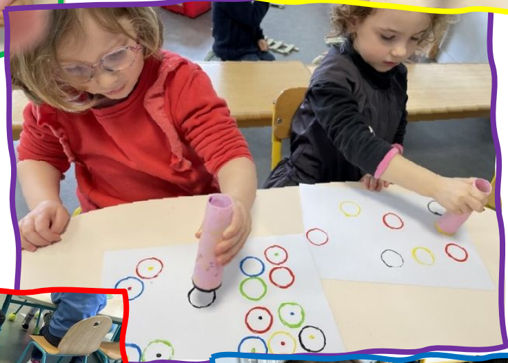
Réalisation d'un tableau de PÂQUES, avec les couleurs des anneaux Olympiques...