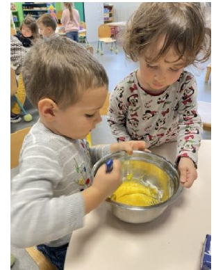
On verse le sucre et on ajoute les jaunes d'œufs.