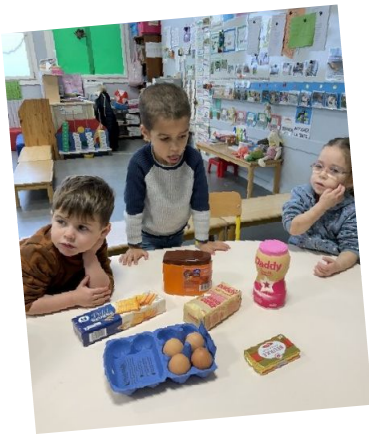
Les ingrédients :

175 g de biscuits ; 125g de cacao ; 100g de sucre, du sucre glace ; 125 g de beurre ; 4 jaunes d'œufs