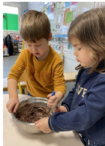
... MIAM !!!...