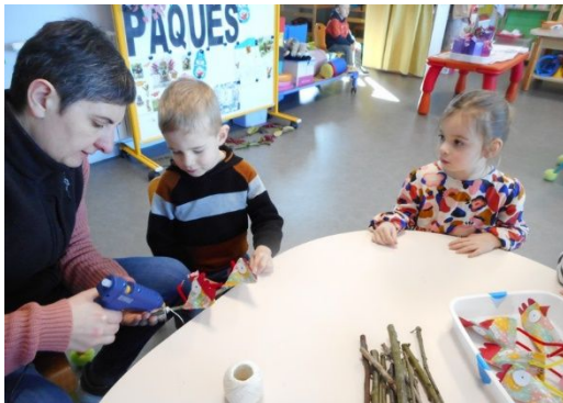
On réalise l'assemblage des « poulettes » en respectant le schéma.