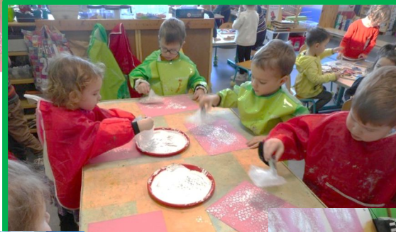
Des petits points blancs comme des flocons de neige...