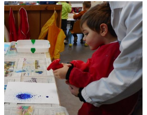
Une autre technique de peinture : peinture avec un flacon vaporisateur pour obtenir des effets «mouchetés».