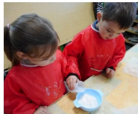
Un atelier PLÂTRE qui continue : verser la poudre ; rajouter de l'eau et mélanger...