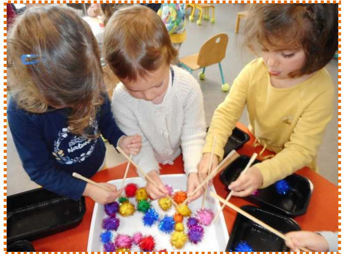
Les enfants ont manipulé des baguettes pour attraper des boules de coton (qui brillent !) : un bon exercice pour développer la motricité fine (et pour s'amuser aussi !).