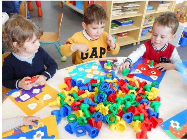
Les nouveaux camarades ont déjà pris quelques repères et ils apprécient participer aux activités.