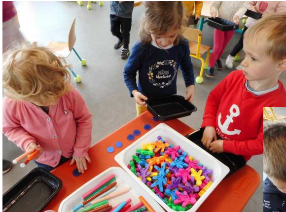
Les enfants ont joué au jeu « de la marchande ».