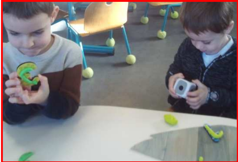
Les enfants ont appris à connaître les écritures chiffrées 1 - 2 - 3 en les modelant à partir d'un modèle afin de découvrir leurs caractéristiques.