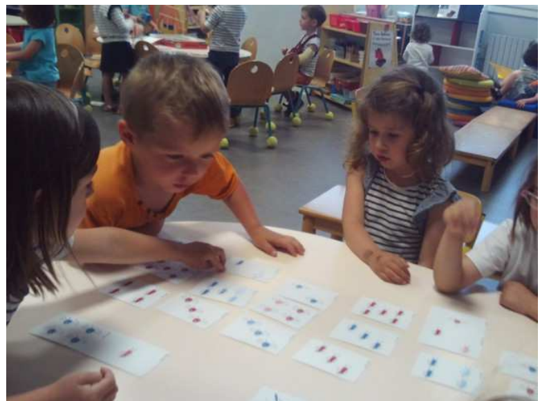
Les enfants recherchent la réponse en fonction des critères qui leur ont été donnés : critère de nomination, de quantité et de couleur.