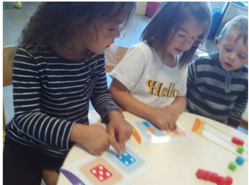
Les enfants ont participé à un atelier pour apprendre à dénombrer une collection : avec l'aide des représentations des doigts de la main ; avec l'aide des constellations du dé.