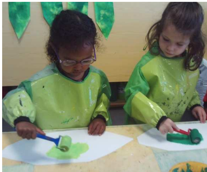
Les enfants réalisent un personnage de l'album de « M'TOTO », en peinture avec un rouleau.